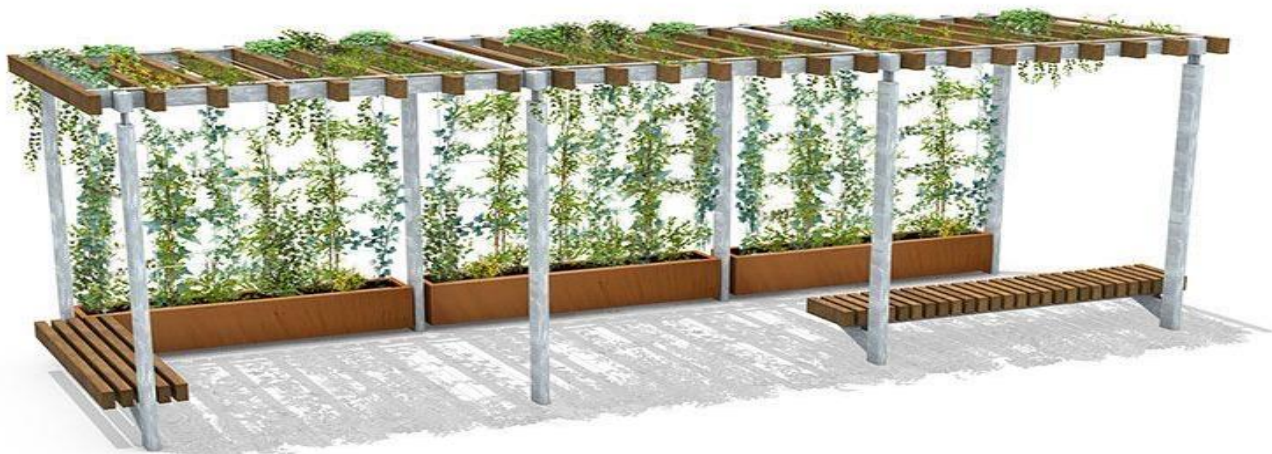
Bancs abrités par des végétaux plantés en jardinières.