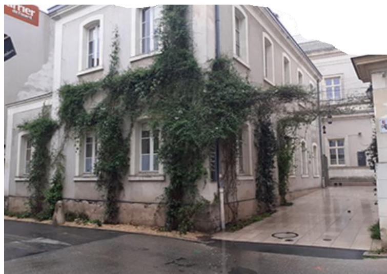
Banc abrité à végétaliser avec des plantes grimpantes tuteurées sur des câbles comme ces façades à Angers.